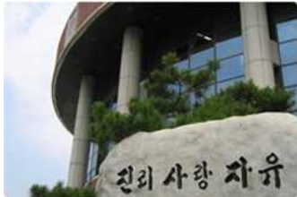
산학협력 활성화 및 지역거점 특성화 추진 (2002 ~ 현재)