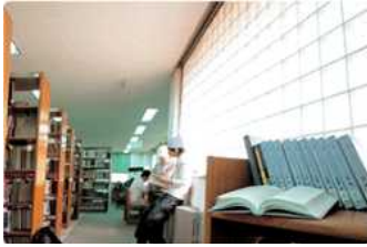
교육개혁 우수대학으로 도약 (1997~2002)