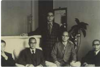
설립 및 사회참여 전통 수립 (1938-1980)