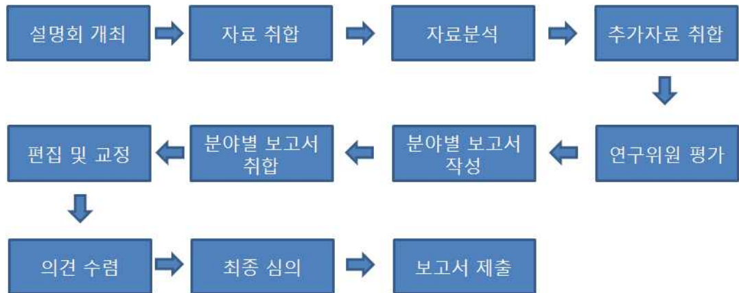
<그림> 자기점검평가체계 흐름도