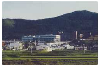
진보적 종합대학으로 발전 (1980-1996)