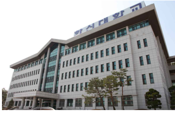
산학협력 활성화 및 지역거점 특성화 추진 (2002 ~ 현재)